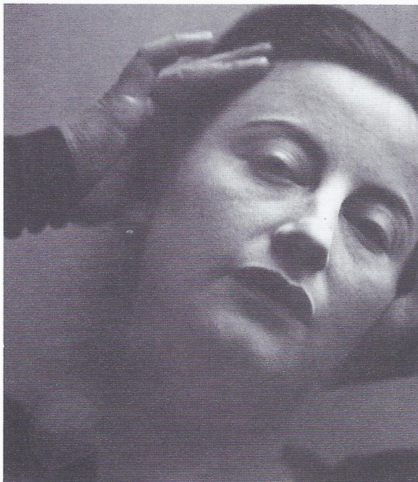
Lotte Laserstein, 1934, Fotografin: Traute Rose

Nach Deutschland kehrte Laserstein nach dem Krieg nur besuchsweise zurück, eine Remigration kam nicht in Frage. Zu viele schreckliche Erinnerungen verbanden sich für sie mit diesem Land. Ihre erste Reise in die einstige Heimatstadt unternahm sie 1954. Welch Überwindung sie diese gekostet hat, illustriert der Bericht eines Freundes, dem sie später anvertraute, dass sie nach der Ankunft in Berlin lange gezögert habe, überhaupt aus dem Zug auszusteigen. Schließlich überwand sie sich, doch war der Besuch eine erschütternde Enttäuschung. Das Berlin, ihr Berlin, wie sie es in Erinnerung hatte, gab es nicht mehr.