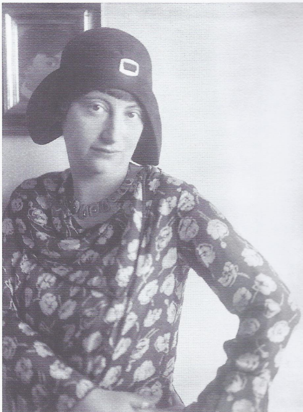
Lotte Laserstein vor einem Selbstporträt, um 1928, Fotografin: Traute Rose

Eine nicht gehaltene Rede anlässlich der Anbringung einer Berliner Gedenktafel in der Jenaer Straße 3